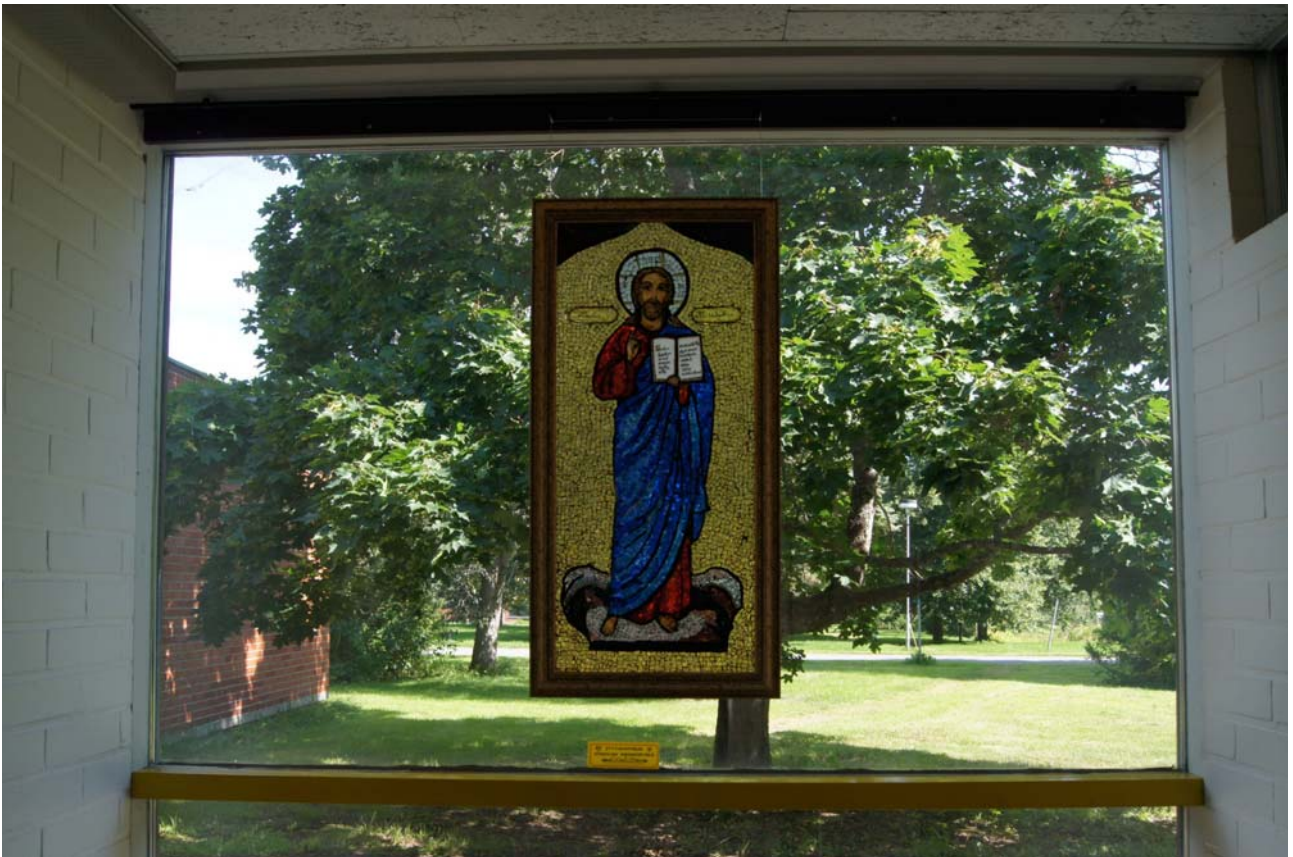
Мозаичная икона на стекле в главном здании монастырского центра в исполнении Кюлиikki Суси. Вид на озеро Пяярви с набережной монастырской бани.