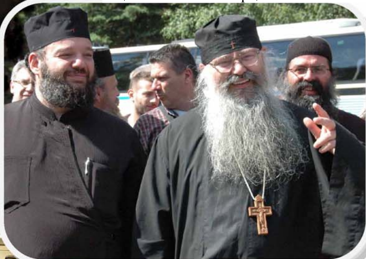
Главный гость летнего семинара - игумен Свято-Андреевского скита на Святой Горе Афон отец Ефрем