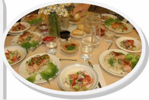
Трапезная и кухня монастырского центра